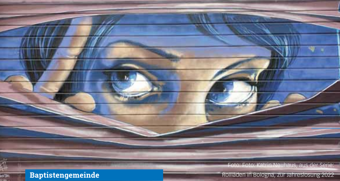
aus der Serie: Rollläden in Bologna, zur Jahreslosung 2022