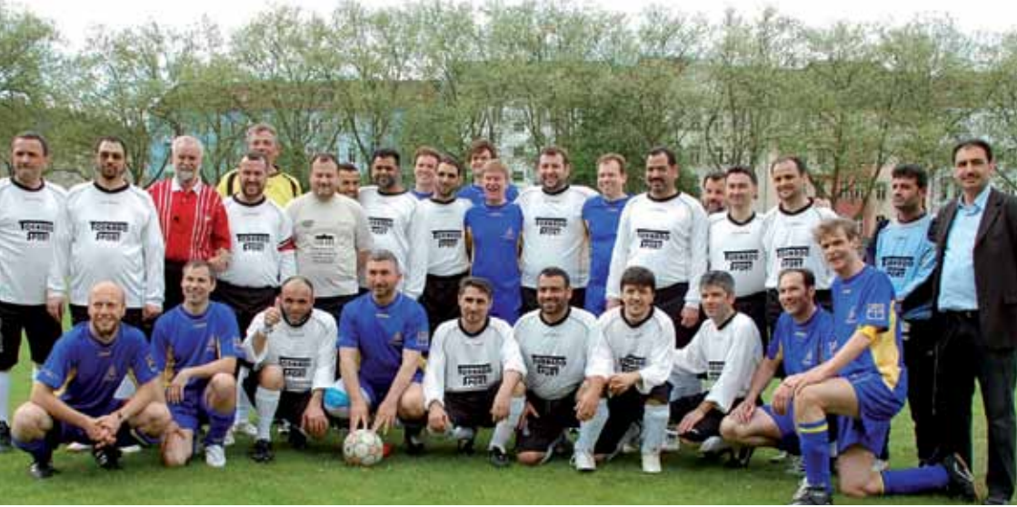
Ihre zahlenmäßige Überlegenheit brachte den Imamen (in weiß) im Jahr 2009 keinen Vorteil. Sieben Pfarrer hielten ohne Auswechslungsmöglichkeiten, das 0:0 über zweimal dreißig Minuten.

nahme abgesehen – Heinrichs katholische Tochter Maria (Bloody Mary) aus der Ehe mit Katharina regierte von 1553-1558 – blieb es dabei bis zum heutigen Tag.