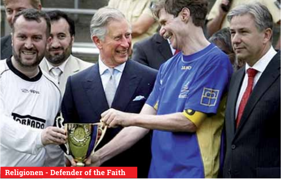
Religionen - Defender of the Faith